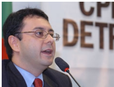
Ariosto à deputança gaúcha: “preciso fazer uma lipo”

EX-SECRETÁRIO DO PLANEJAMENTO DE ESQUEMAS DO ESTADO SE DEFENDE NA CPI DO CIRETRAN